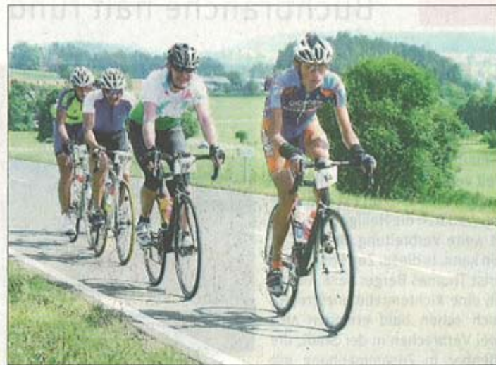
Der Radmarathon wird im August in Stockheim ausgetragen.